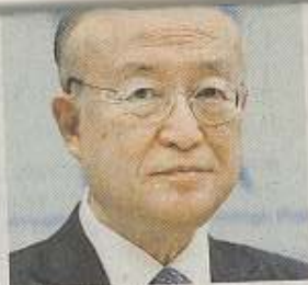
Yukiya Amano, Director General, IAEA

last report on Iran in May, Amano said that "timely and proactive cooperation by Iran in providing such access will facilitate implementation... and enhance confidence." In