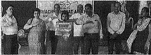
▲ தூய்மை இந்தியா திட்டம் குறித்த விழிப்புணர்வு நிகழ்ச்சியில் மத்திய பெண்கள், குழந்தைகள் நல அமைச்சக செயலாளர் சிதா மிட்டல் உள்ளிட்டோர் பங்கேற்றனர்.

சென்னை முல்லைநகரில் உள்ள ஆதர்வற்ற குழந்தைகள் இல்லமான தொன் போஸ்கோ அன்பு இல்லம் குழந்தைகள் காப்பகத்தில் நேற்று தூய்மை இந்தியா திட்டம் குறித்த விழிப்புணர்வு நிகழ்ச்சி நடத்தப்பட்டது.